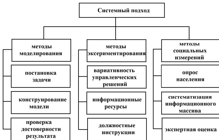
Рис. 2. Системный подход к формированию медико-географического механизма охраны здоровья населения (составлен автором)

В исследовании факторов формирования здоровья населения широко применяются методы моделирования . Они применимы там, где решаются сложные проблемы, требующие системного и комплексного подходов, например, при выявлении воздействия среды обитания на здоровье населения [6]. То же самое характерно и для интегральной оценки динамики состояния общественного здоровья за длительный период трансформации условий жизни населения. Моделирование осуществляется в несколько этапов: на первом этапе, исходя из цели исследования, осуществляется постановка задачи, на втором этапе конструируется модель, на третьем этапе проводится проверка результатов моделирования на достоверность.